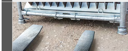
4 Stapelbar für bis zu 4 Boxen übereinander